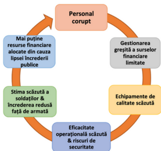
Ciclul corupției în sectorul de securitate

Corupția împiedică, în special, progresul țărilor aflate în tranziție, precum este Republica Moldova, eliminând, prin acțiuni ilegale a resurselor necesare, din eforturile de edificare a statului de drept. Resursele furnizate prin practici corupte sunt adesea transformate în influență economică și politică, slăbind astfel instituțiile democratice și extinzând în continuare corupția. Sectorul de securitate și apărare națională este afectat de corupție, iar manifestările acestui fenomen pot lua mai multe forme, cum ar fi: mita, acordarea de contracte necompetitive, traficul de influență, trucarea achizițiilor publice, pantuflajul și utilizarea necorespunzătoare a bugetelor [5].